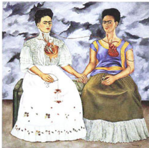
As duas Fridas (1939)