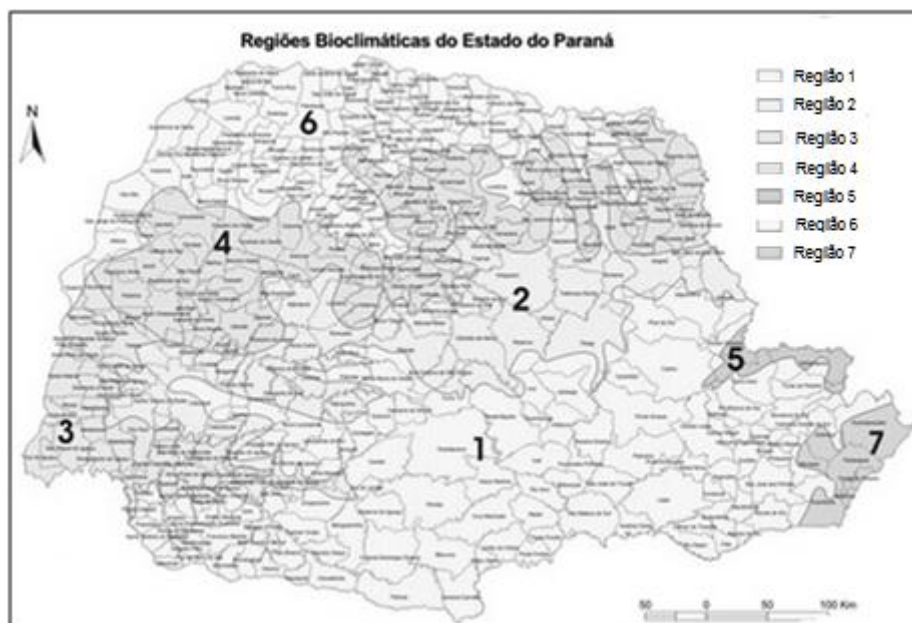
Figura 1. Regiões Bioclimáticas do estado do Paraná.

As espécies foram selecionadas por região bioclimática tendo por base o zoneamento ecológico para plantios florestais no estado do Paraná (Carpanezi, 1986). Sete regiões bioclimáticas foram distribuídas conforme ilustrado na Figura 1. Essas regiões orientam a coleta e distribuição de sementes e mudas nos viveiros do IAP e nos conveniados com o Programa Mata Ciliar.