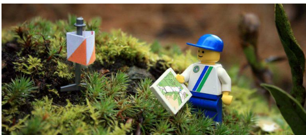
Figura 1. Lego Orientação: para ilustrar uma prática de Orientação na floresta, com prisma marcando o ponto de controle e o mapa sendo utilizado pelo praticante.

AULA 1: a professora apresentou aos estudantes o que é a Orientação, em uma conversa em sala de aula com apresentação de vídeo 1 e imagens sobre a prática (Figura 1), e foram levantadas informações e curiosidades, onde os estudantes puderam fazer questionamentos sobre a prática e se familiarizarem com o tema. Na sequência a professora esclareceu sobre a importância de cores e símbolos utilizados em um mapa de Orientação, informando que a prática pode ser feita em ambientes urbano e/ou floresta. Nesta aula a avaliação se deu de forma diagnóstica e observacional, onde a professora considerou o envolvimento dos estudantes com o tema, se participaram da conversa e se expuseram suas impressões.