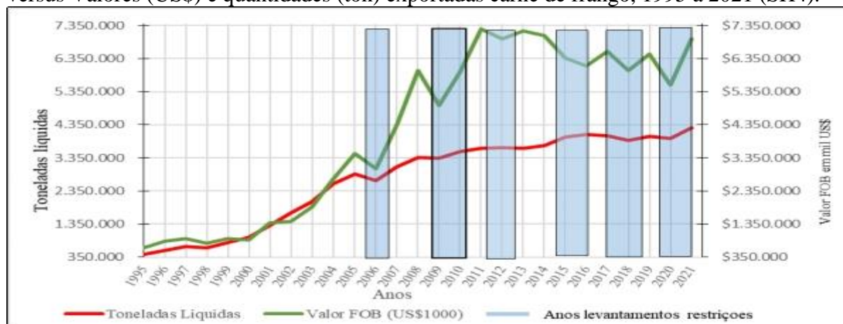
Gráfico 3: Anos dos levantamentos das restrições das exportações de carne de aves brasileiras versus Valores (US$) e quantidades (ton) exportadas carne de frango, 1995 a 2021 (SH4).

Fonte: Elaborado a partir Ministério da Indústria, Comércio Exterior e Serviços – MDIC (BRASIL, 2022) e (WTO, 2022b). OBS: Dados MDCI disponíveis a partir de 1997. Para 1995 e 1996 dados da FAO (2022).