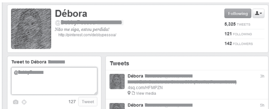
Figura 01 – Perfil de um usuário do Twitter

O Twitter é uma das redes sociais que mais se destaca na atualidade. Nele os usuários podem postar em sua timeline sobre qualquer assunto, sendo limitados a 140 caracteres por postagem, o que possibilita conteúdos de menor massa e maior clareza, bem como uma quantidade de absorção maior, já que os textos são curtos e a leitura é facilitada