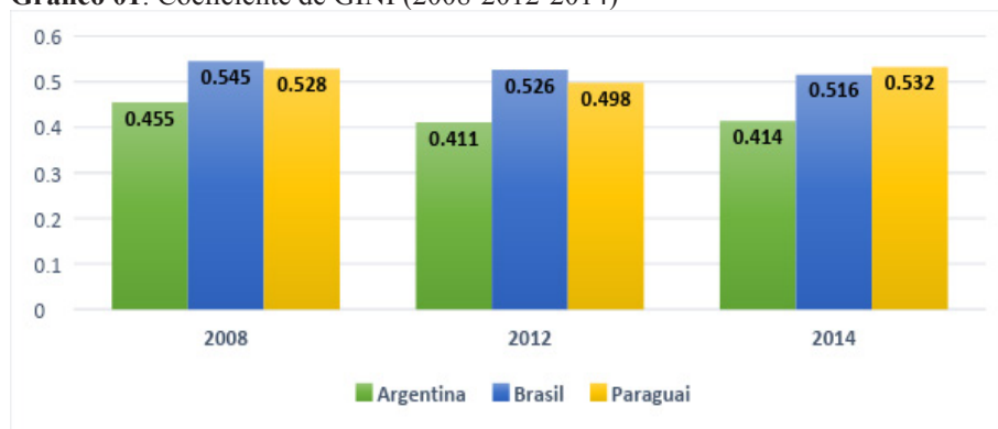
Gráfico 01: Coeficiente de GINI (2008-2012-2014)

Dados dessa extrema desigualdade social na Argentina, no Brasil e no Paraguai pode ser verificado com o Coeficiente de Gini, enquanto um dos instrumentos usados para medir o grau de concentração de renda, apontando a diferença entre os rendimentos dos mais pobres e dos mais ricos. Numericamente, varia de 0 a 1, sendo que 0 (zero) representa a situação de total igualdade, ou seja, todos têm a mesma renda, e o valor 1 (um) significa completa desigualdade de renda, isto é, uma só pessoa detém toda a renda do lugar.