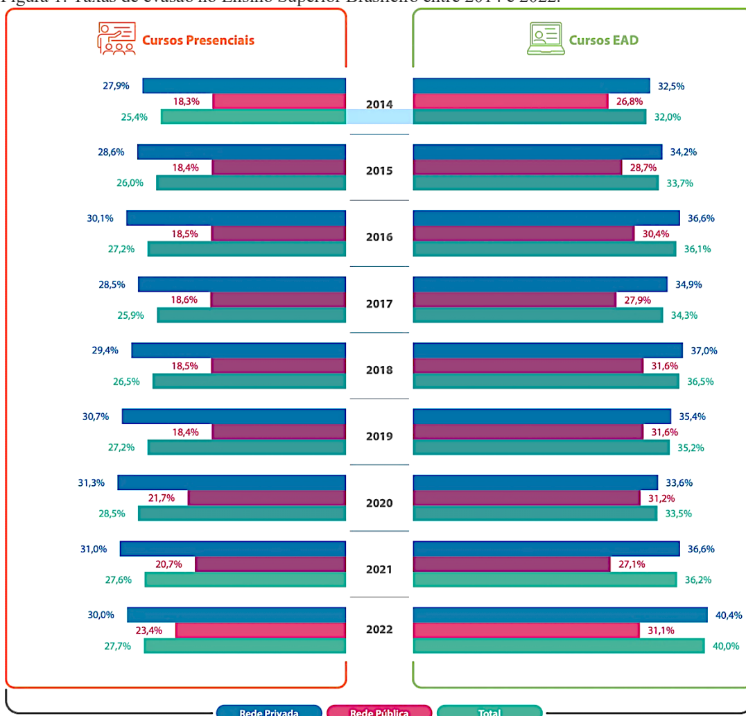
Figura 1: Taxas de evasão no Ensino Superior Brasileiro entre 2014 e 2022.