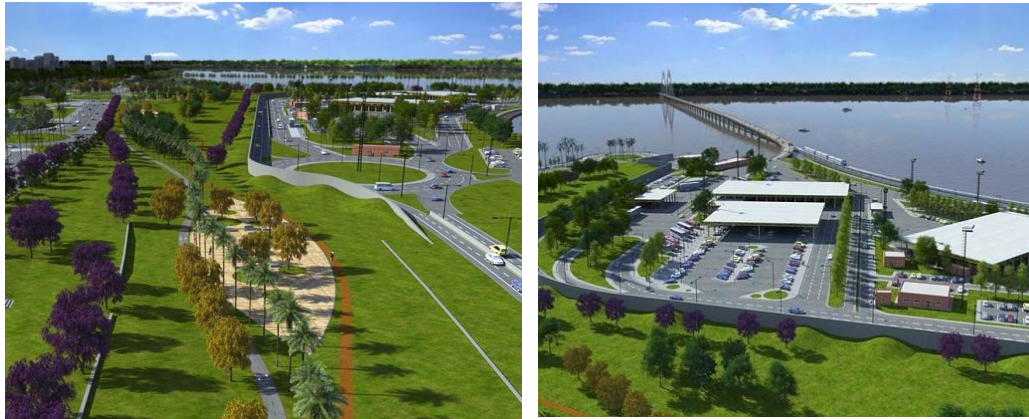
Figura 3: Propuesta de espacios verdes y parques recreativos