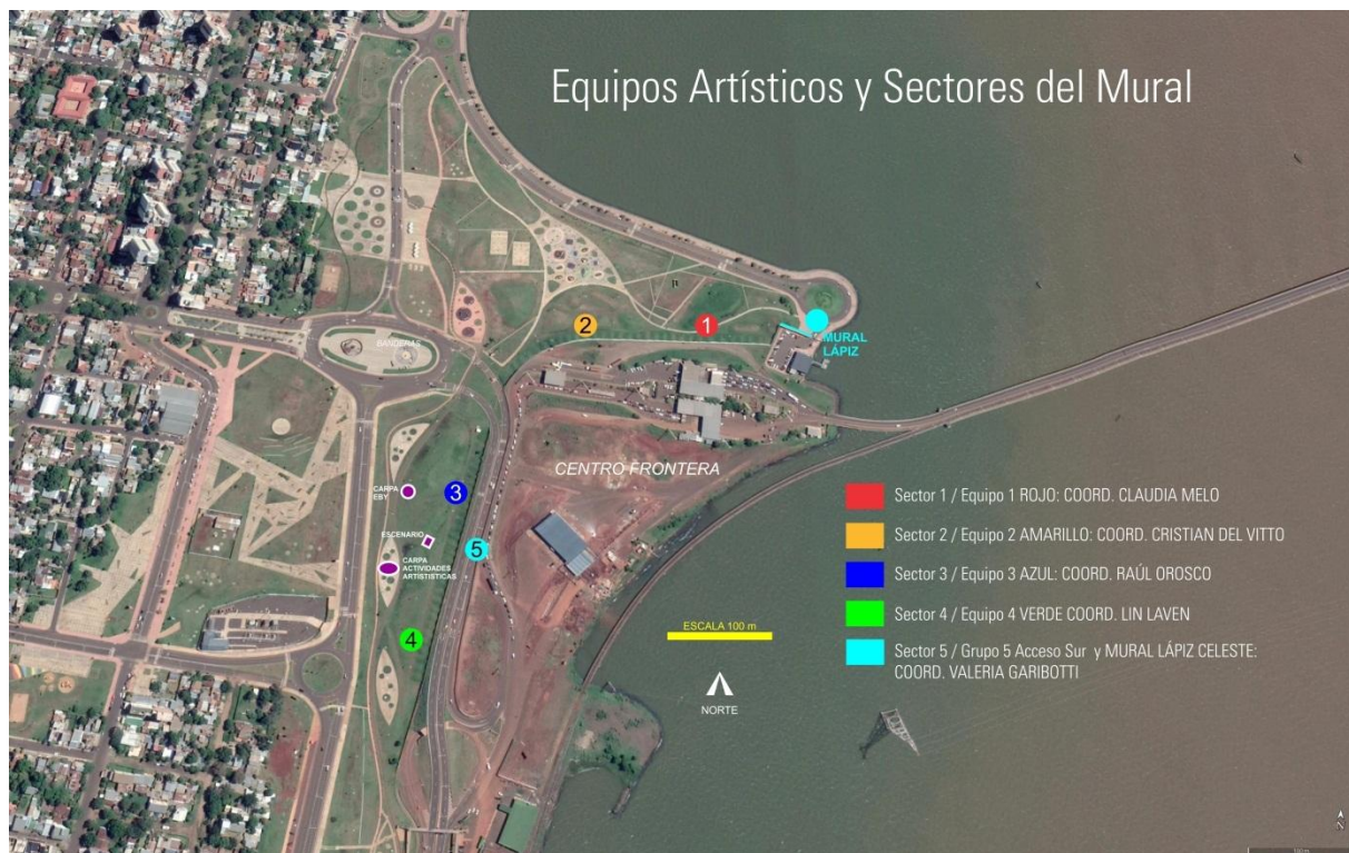
Figura 4: Equipos artísticos y sectores del mural