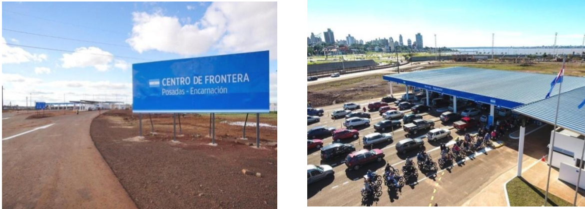
Figura 1: Centro de Frontera Posadas (Misiones – Argentina) – Encarnación (Paraguay).