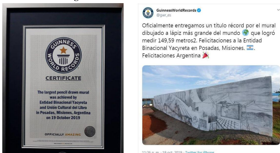
Figura 6: Certificación de Guinness World Records