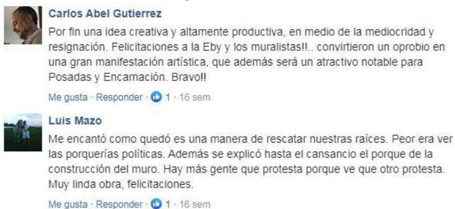
Figura 7: Redes sociales.