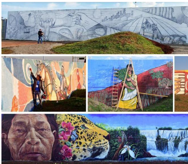
Figura 5: El mural