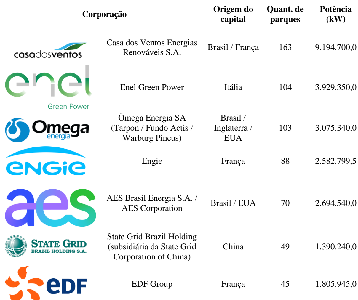
Tabela 2 - Brasil - Principais corporações com presença de capital internacional com projetos eólicos outorgados.

Outras apresentam um histórico recente, como o exemplo da brasileira Casa dos Ventos Energias Renováveis, que foi constituída em 2007 por um empresário que anteriormente atuava no setor têxtil e automobilístico. A presença do capital financeiro também é relevante, fundos que possuem um amplo portfólio de investimentos, como o caso das gestoras canadenses Brookfield Asset Management, Ontario Teachers Pension Plan e Canada Pension Plan controlam empresas de geração de energia eólica. Por fim, outro grupo que merece destaque é conformado pelas empresas estatais chinesas, como a State Grid Brazil Holding, que desde 2017 assumiu o controle acionário da CPFL Energia. Esta diversidade de tipologia de agentes evidencia, mais uma vez, que o setor de geração de energia eólica é considerado como um mercado lucrativo para a expansão de investimentos e consequente acumulação de capital.