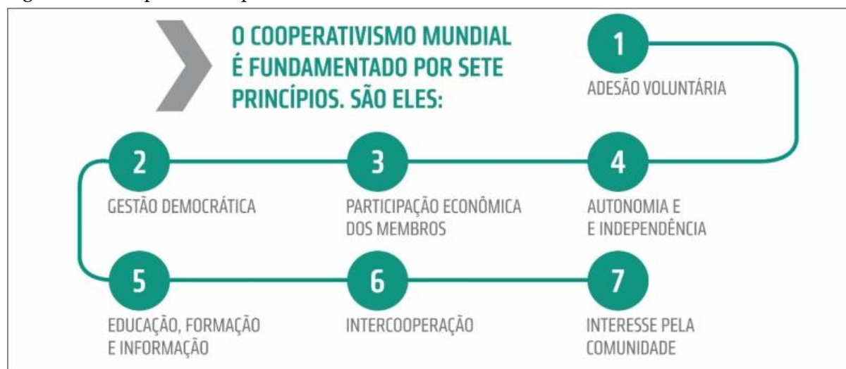
Figura 1 – Princípios do Cooperativismo Mundial