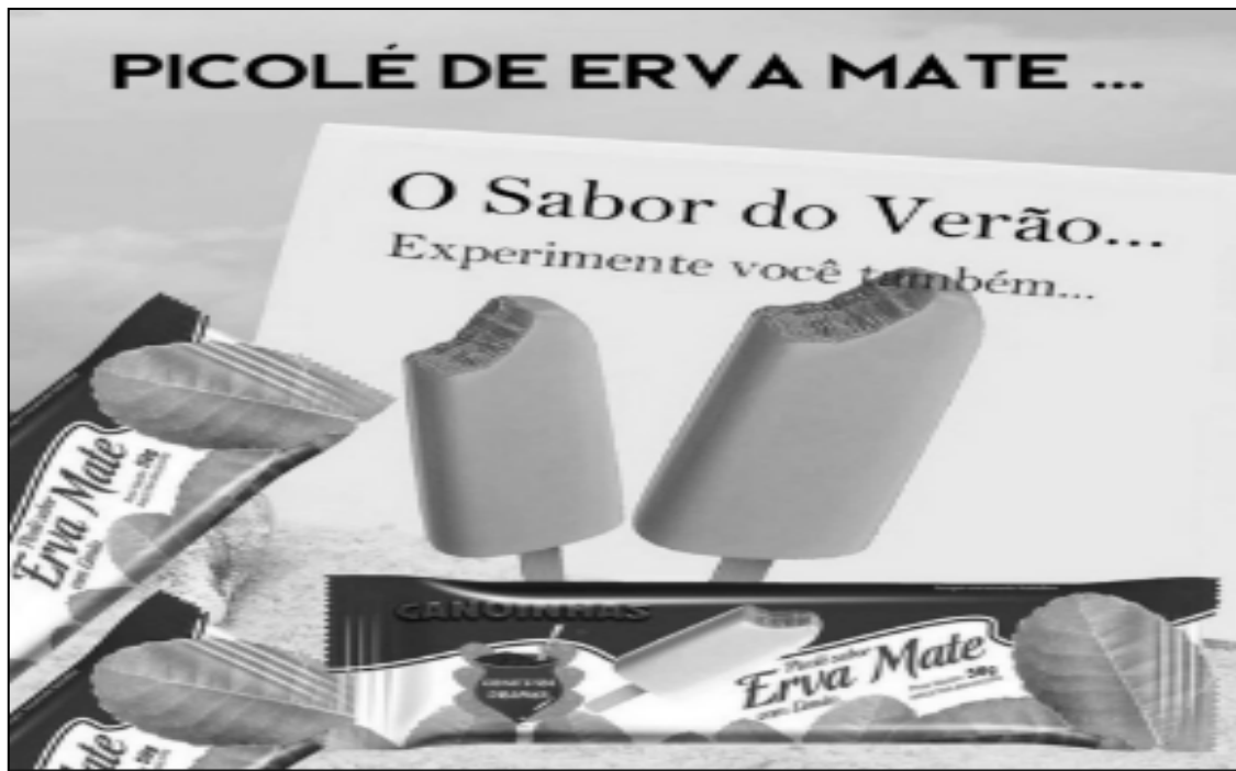
Figura 3 - Publicidad de helado con sabor a hierba mate.