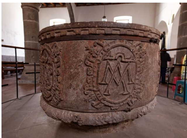
Figura 3. Pila bautismal de la iglesia de San Pedro y San Pablo se encuentra a un costado del altar principal. (Fotografía cortesía del proyecto Provincia de Jilotepec, de la Dirección de Etnohistoria, INAH, México).

Con estos datos y con el propósito de conocer una parte del proceso onomástico en México, se han analizado actas bautismales de finales del siglo XVII de la población mencionada, en las que se asienta un amplio léxico nominal implementado por la evangelización. Este hecho de gran trascendencia innovó el repertorio léxico en la nomenclatura de individuos indígenas, ya que con ello se trastocó por completo la identidad de los habitantes mesoamericanos. (Figura 3)