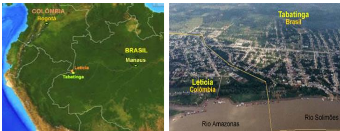
Figura 1 e 2 localização da área de estudo