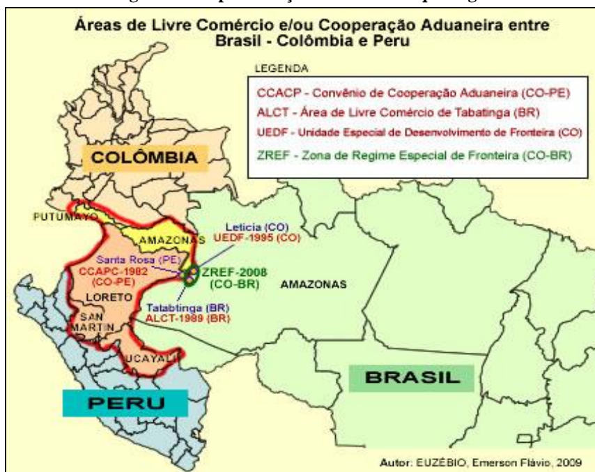
Figura 3 – Espacialização das normas que regulam os fluxos fronteiriços