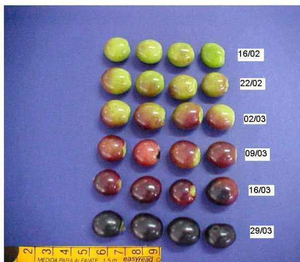
FIGURA 1 - Estádios de maturação de frutos de tarumã em função da data da colheita.

A modificação na coloração do epicarpo dos frutos de tarumã (Figura 1, Tabela 1) evidencia rápidas alterações em função do processo de maturação. A identificação da qualidade das sementes relacionada com a coloração dos frutos é importante para especificar a época de colheita (CARVALHO & NAKAGAWA, 2000).