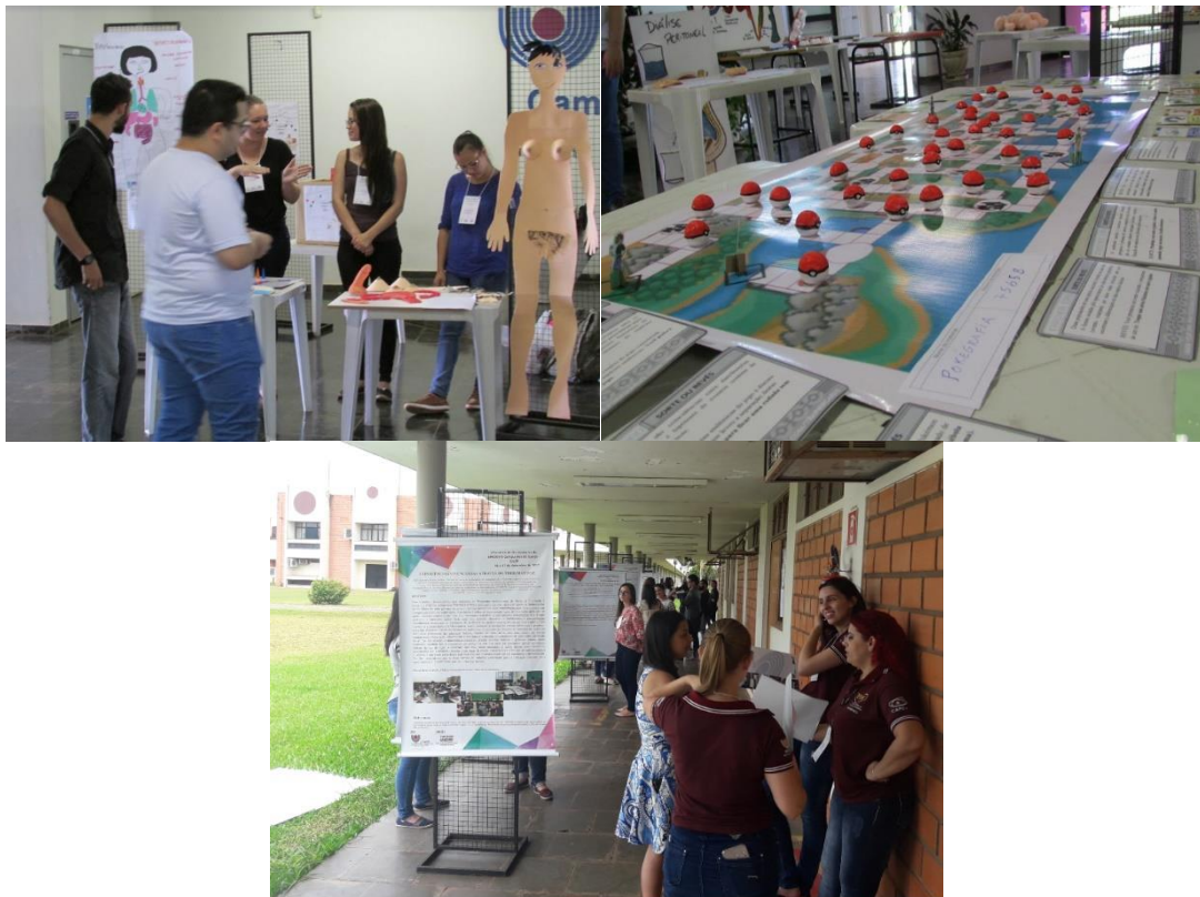
Figura 1 – Algumas imagens de integração entre as licenciaturas no I ELUFI.