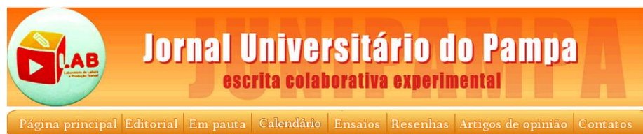
(Cabeçalho do Junipampa)

A cor laranja, que aparece de fundo, na parte superior da página principal do Junipampa e nas suas laterais como forma de fazer com que essas partes da página conversem entre si, aparece também na maioria dos contornos e letreiros do webjornal, mantendo um equilíbrio na apresentação da página. Para questões de design, a cor laranja indica ação e, segundo relato da coordenadora do LAB, foi por esse motivo que essa cor foi escolhida para ajudar a compor a aparência do Junipampa.