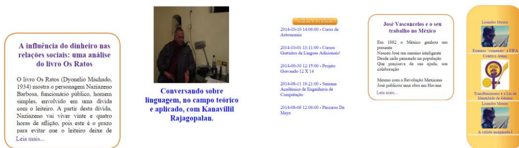
(Chamadas das matérias do Junipampa)

Os contornos e formas arredondadas, bem como o jogo de cores que compõem a escrita das chamadas das matérias apontam para um caráter de modernidade. O design arrojado e moderno ajuda a compor uma superfície discursiva que comunica que o Junipampa está conectado com as mudanças e avanços tecnológicos da atualidade. Além disso, o jogo de cores presente na escrita das chamadas age como uma estratégia para chamar a atenção do leitor para o texto.