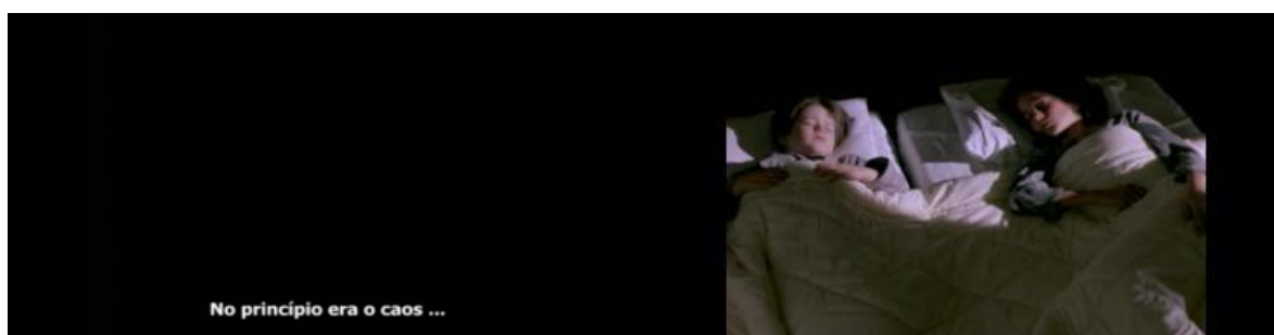
Figura 1 – Cenas de Paisagem na neblina (1988)

Fonte: Paisagem na neblina (1988), 5min29s; 6min40s