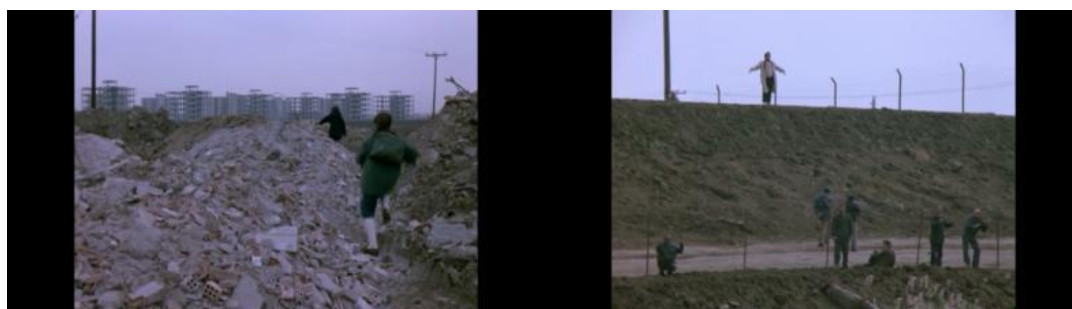
Figura 2 – Cenas de Paisagem na neblina (1988)

Fonte: Paisagem na neblina , 7min; 7min50s