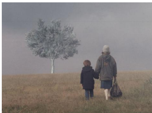
Figura 5 – Cena de Paisagem na neblina (1988)

A “necessidade de se descartar o passado como promessa de salvação futura” fica explícita na relação entre as gerações, cuja não-identidade constitui uma ruptura dolorosa, geradora de melancolia e de desamparo, mas igualmente necessária. O final de Paisagem na neblina , certamente, endossa o descarte desse pesado passado, que continua “passando”, e aponta para uma abertura. Depois de passar pelas situações mais brutais, que um rito de iniciação pode envolver, como o sexo (no estupro de Voula), o total desamparo da família e das autoridades, bem como a morte, Angelopoulos nos apresenta um final, paradoxalmente, esperançoso.