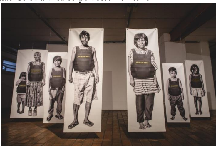
Figura 1 – Obra Invasão Colonial meu corpo nosso Território