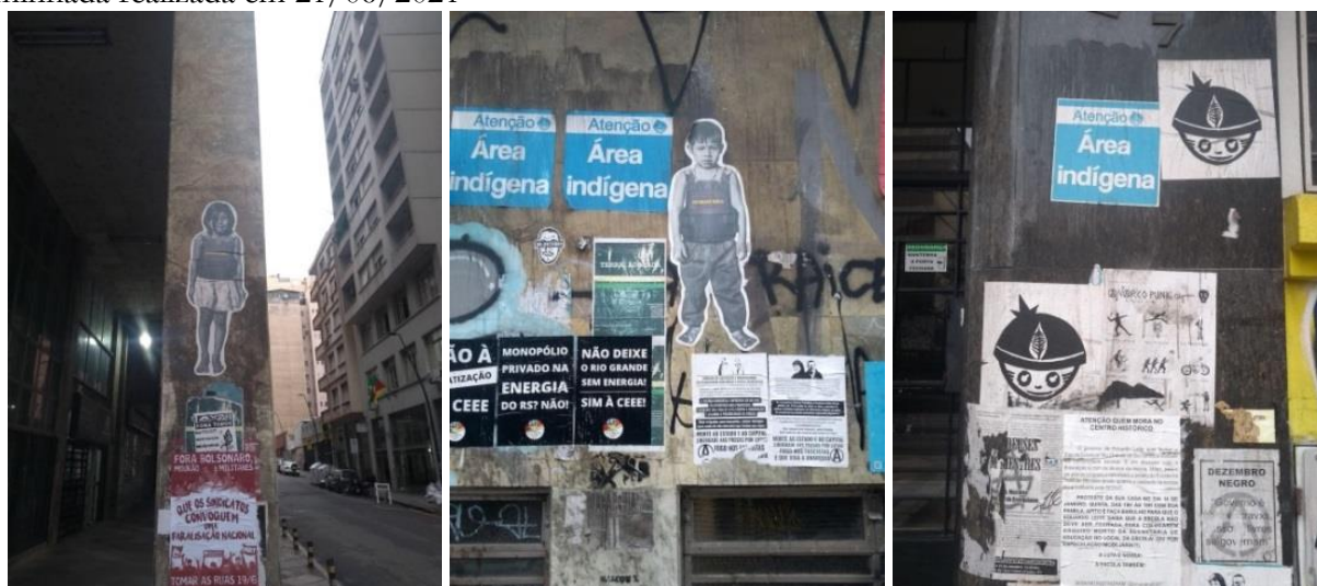
Figuras 7, 8 e 9 – Pontos do Centro Histórico da cidade de Porto Alegre fotografados durante a caminhada realizada em 21/06/2021