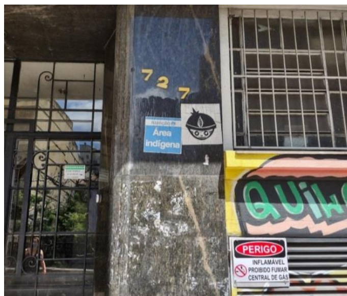
Figura 3 – Stickers “Área indígena” e “Indiozinho Xadalu” aplicados em ponto do Centro Histórico de Porto Alegre