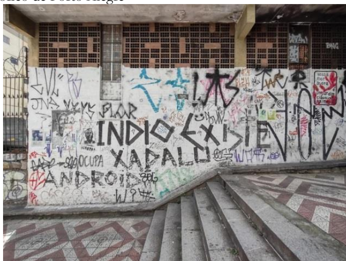
Figura 4 – Pixo da frase “Índio Existe” na escadaria da Avenida Borges de Medeiros esquina com a Rua Duque de Caxias, no Centro Histórico de Porto Alegre