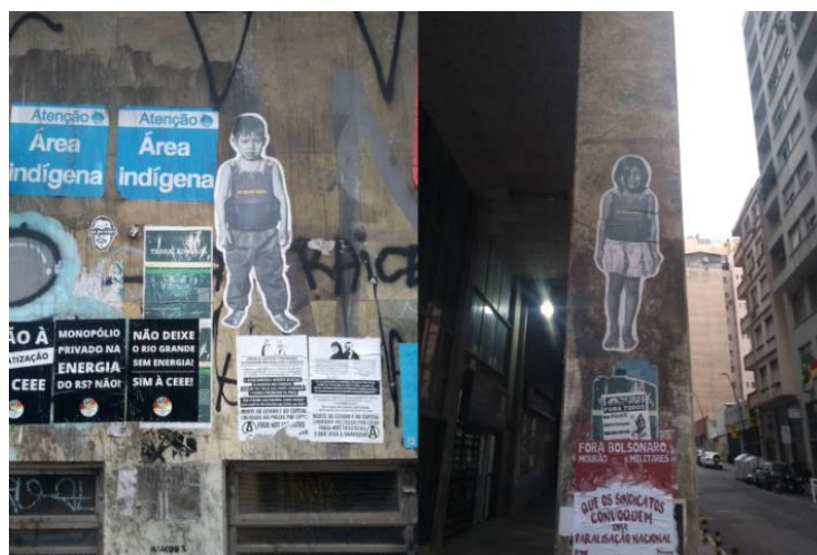
Figura 2 – Aplicações da obra em pontos do Centro Histórico de Porto Alegre