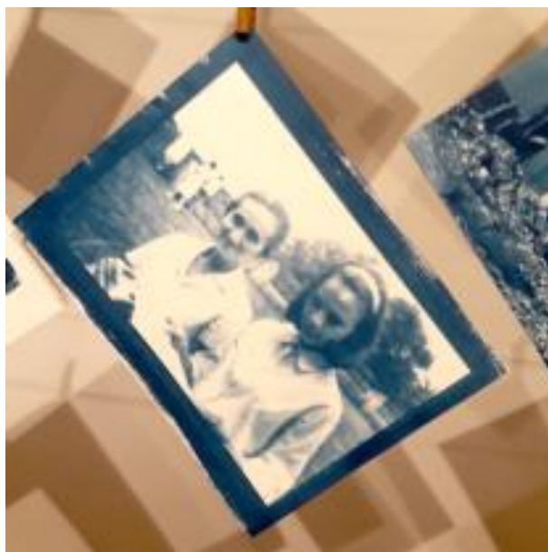
Figura 5 – Registro da exposição Fotos Sínteses, “Adeus, felicidade”, 2022