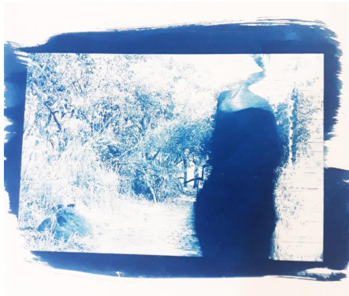
Figura 1 – “Tu”, série Sete Vezes, ensaio em cianotipia, 2022

experimentada no excesso de sentidos do corpo sem órgãos 5 , planejando o desejo como processo de produção independente para além da ordenação cartesiana que fragmenta vida e cultura, como se esta não fosse uma elaboração do exercício vital? Será a criação artística capaz de transmutar concepções metafísicas através de imagens, sons, experiências e processos?