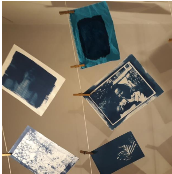
Figura 4 – Registro de fotos sínteses em cianotíпия, séries variadas, 2022