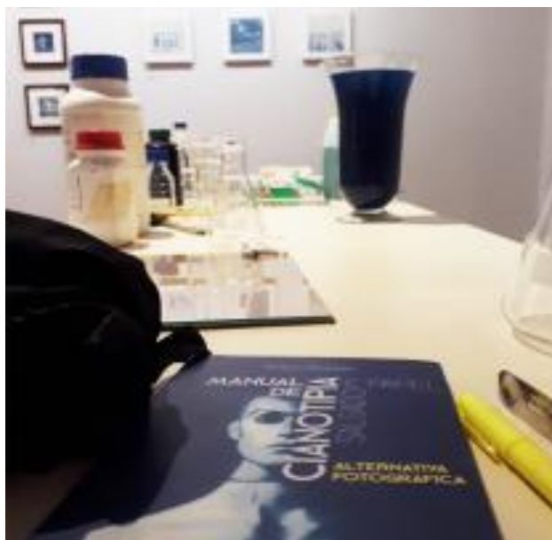
Figura 3 – Registro da exposição Fotos Sínteses, 2022