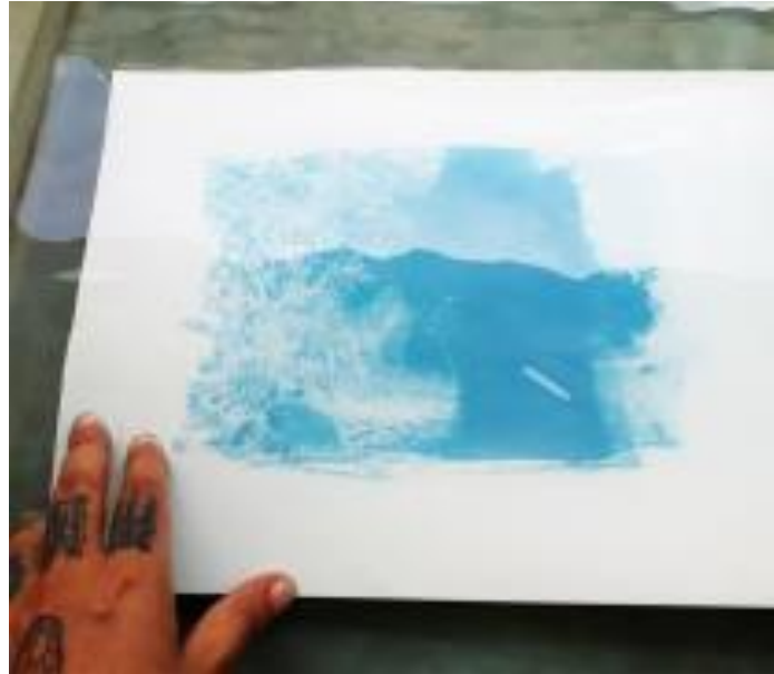
Figura 2 – Registro de aula, 2022