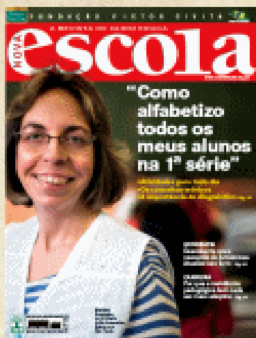
Capa 5 Revista Nova Escola ed.201 abril/2007