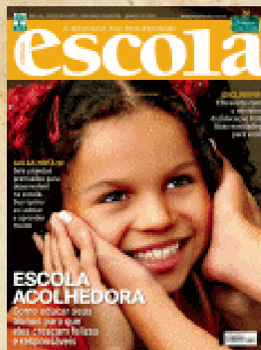
Capa 6 Revista Nova Escola, ed. 188 março/2007