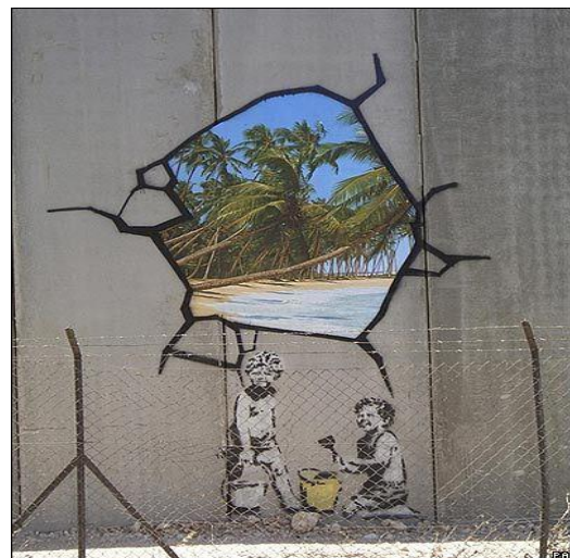
Obra na Palestina. Mistura de Técnicas: estêncil e pôster impresso.

Temos, então, uma obra móvel, em constante trânsito, que não simplesmente reclama a cidade como tela, fundo para sua exibição, mas que, pelo contrário, muitas vezes coloca-a como a própria obra, interferindo diretamente em sua significação. Não à toa, alguns dos trabalhos mais líricos e políticos de Banksy podem ser encontrados na New Orleans pós furacão Katrina