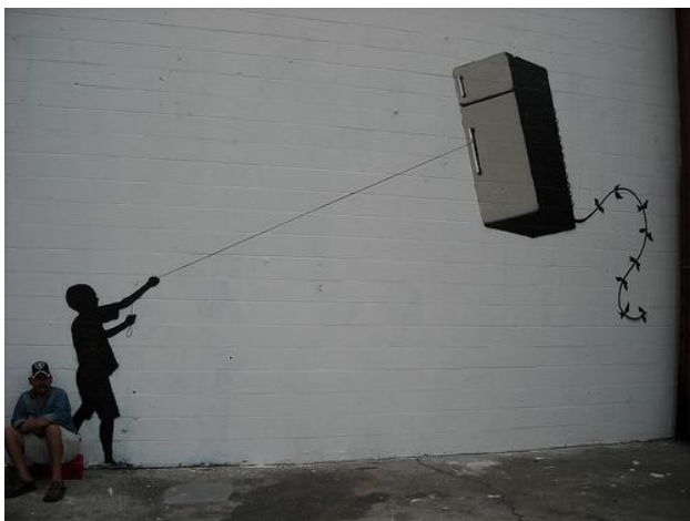
New Orleans: lembranças do furacão Katrina

Dançar de forma bizarra durante a noite inteira nos caixas eletrônicos dos bancos. Apresentações pirotécnicas não autorizadas. Land-art , peças de argila que sugerem estranhos artefatos alienígenas espalhados em parques estaduais. Arrombe apartamentos, mas, em vez de roubar, deixe objetos Poético-Terroristas. Seqüestre alguém & faça-o feliz. [...] Coloque placas de bronze comemorativas nos lugares (públicos ou privados) onde você teve uma revelação ou viveu uma experiência sexual particularmente inesquecível etc. Fique nu para simbolizar algo. Organize uma greve em sua escola ou trabalho em protesto por eles não satisfazerem a sua necessidade de indolência & beleza espiritual. A arte do grafite emprestou alguma graça aos horríveis vagões de metrô & sóbrios monumentos públicos – a arte TP 6 também pode ser criada para lugares públicos: poemas rabiscados nos lavabos dos tribunais, pequenos fetiches abandonados em parques & restaurantes, arte-xerox sob o limpador de pára-brisas de carros estacionados, slogans escritos com letras gigantes nas paredes de playground, cartas anônimas enviadas a destinatários previamente eleitos ou escolhidos ao acaso (fraude postal), transmissões de rádio piratas, cimento fresco... (BEY, 2003. p. 9).