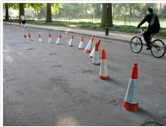
Intervenção com cones

trabalhador social, de micropolítica e representação de voz minoritária, de uma pertinente inclinação à esquerda, de um apreço à denúncia, ao manifesto”.