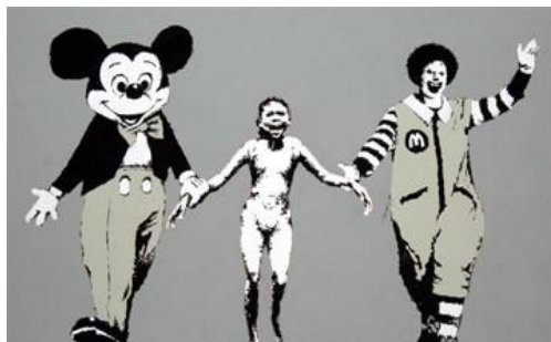
Bem vindo ao fantástico mundo do entretenimento

Banksy atua como um reciclador de signos pré-existentes, ready-mades semióticos - se quisermos novamente nos aproximar de Duchamp - rearranjados e re-significados. Na verdade, as próprias pinturas a óleo que Banksy modifica e insere em museus podem ser encaradas como ready-mades re-significados. Talvez o melhor exemplo desta conduta esteja expresso na obra abaixo, na remontagem e re-significação de imagens tão corriqueiras, dando-lhes um inteiro novo sentido, suscitando uma associação mental que conjuga infância, entretenimento e horror, capitalismo e guerra, imperialismo e opressão, fast-food e carne humana, a diversão e a alienação do primeiro mundo em contraposição ao sofrimento terceiro mundista.