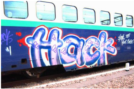
Trem "decorado" com tag

Apesar de ser virtualmente impossível situarmos quando os estênceis de rua – que, conforme observa Macphee (2004), “existem em algum lugar entre os sinais de rua oficiais e o