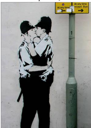
Ganhando credibilidade junto à lei

Se pouco ou nada sabemos sobre a identidade do homem por trás da assinatura, é porque assim se faz necessário, tanto em conformidade com uma arte (o grafite) que já nasceu criminalizada e instantaneamente identificada e rotulada como simples vandalismo - marcando seus praticantes, já de saída, com a insígnia da marginalidade, da ilegalidade -, quanto pela própria convicção do artista em questão, em deliberada manutenção de seu anonimato, cansado que está da vazia fábrica de celebridades do mundo do entretenimento, do culto ao indivíduo em detrimento da obra, do fetiche das imagens públicas construídas, temáticas tão presentes em sua vasta produção.