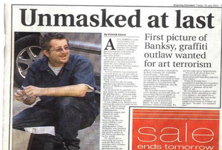
A corrida pelo artista

Assim encontramos Banksy: procurado, como um fora da lei. “WANTED”: como em um velho cartaz de um velho filme de faroeste norte-americano (trocando-se, contudo, a foto do