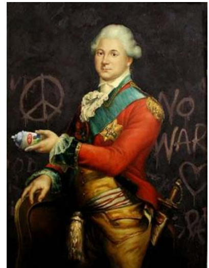
Artista original desconhecido. Pintura a óleo modificada e "instalada" no Museu do Brooklyn. Durou oito dias