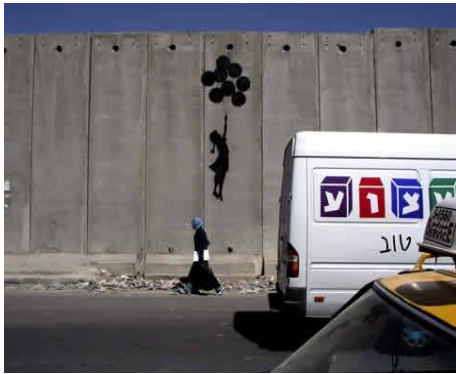
Obra na palestina: ultrapassando os limites dos muros

Em 1976, a quarta geração do Muro de Berlin foi construída. Mais robusto do que as versões anteriores, o muro era agora uma sólida parede de concreto, a prova de água e pintada de branco. Logo após ser completado, tornou-se uma tela para artistas e ativistas no lado ocidental, e não demorou muito para que