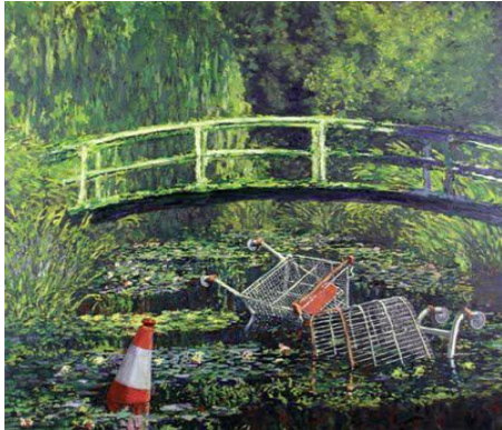
Monet, vandalizado por Banksy

Arte não é como as outras formas culturais, pois o seu sucesso não é ditado por sua audiência. O público enche salas de concertos e cinemas todos os dias, nós lemos romances aos milhões e compramos discos aos bilhões. Nós, o povo, afetamos a produção e a qualidade da maior parte de nossas expressões culturais, mas não da arte. A arte que vemos é feita apenas por poucos selecionados. Um pequeno grupo cria, promove, adquire, exhibe e decide quanto ao sucesso da Arte. Somente uma pequena centena de pessoas no mundo tem voz ativa. Quando você vai a uma galeria de arte, você é simplesmente um turista observando a vitrine de troféus de alguns milionários. (BANKSY, 2005, p. 144).